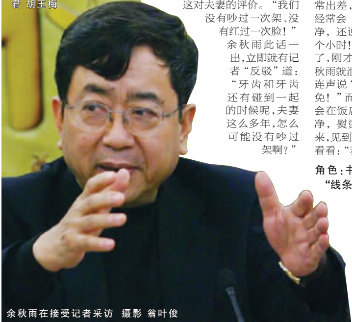
余秋雨在接受记者采访