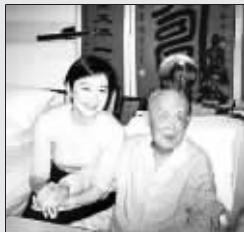
林青霞看望季羡林