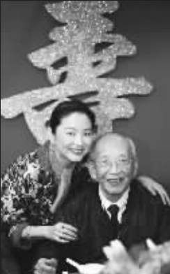
林青霞的父母均已去世,图为林青霞为父亲86岁生日办寿宴时的情景