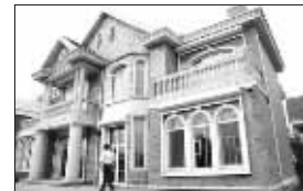
网上曝光的葛优豪宅外景

葛优行事一向低调,其参演的《命运呼叫转移》召开过多次记者见面会,几乎所有主演都亮过相,只有他一人从未现身。在该片终于制作完成举行盛大首映的11月18日,出现在活动现场的他也谢绝接受媒体采访,并表示不谈这部电影。但在正式采访之外的“闲聊”过程中,葛优倒是讲了不少,还推翻了很多近期关于自己的“假新闻”。