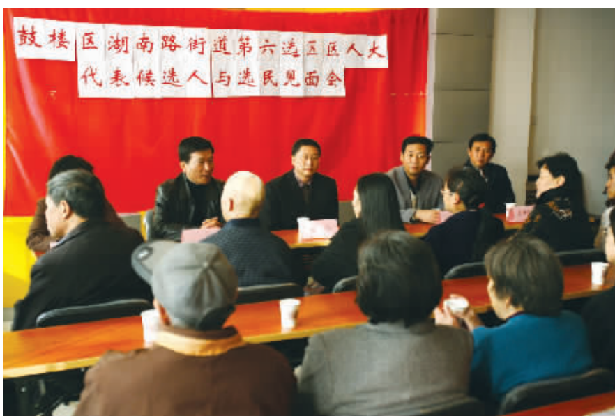
人大代表候选人正在与选民交流

截至11月22日选举日之前,这样的见面会将在南京1447个区县选区、1148个镇选区一一举行,每一位候选人都将面临本选区选民代表的“考评”,由此决定他们能否当选新一届的区县、镇人大代表。