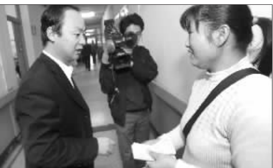
热心市民来到医院看望小航