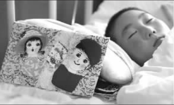
马阿姨给小航带来自己缝制的娃娃