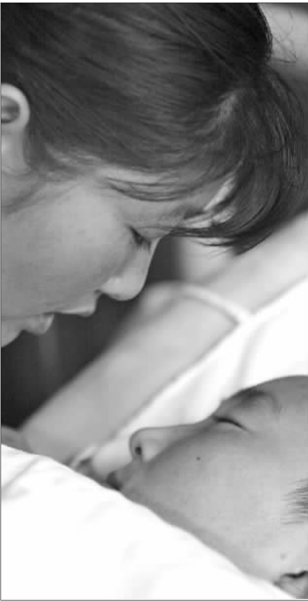
妈妈盼望小航早日康复。