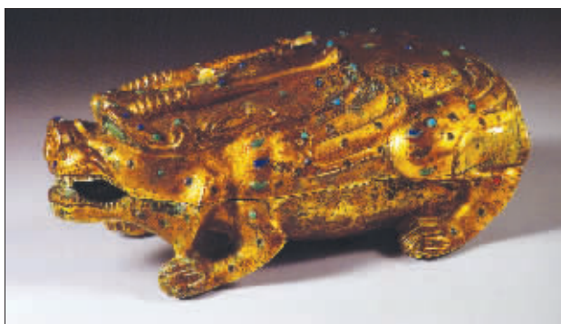
鎏金镶嵌兽形铜盒砚