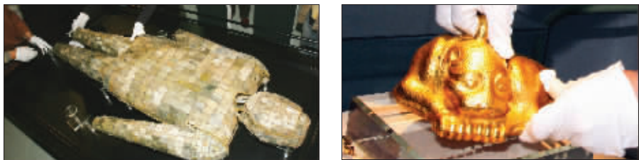
工作人员正在布展,银缕玉衣、金兽就位。