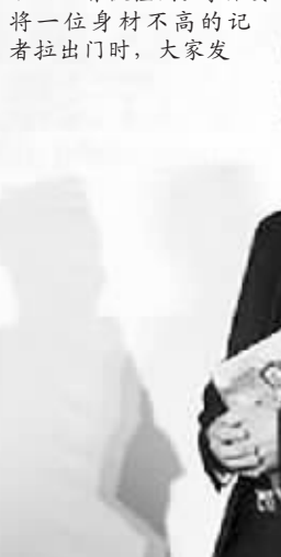
发布会上两人保持距离

现他已经被打出鼻血。另外一名记者要求拿了器材再走,保安不答应,那名记者想挣脱保安,又引起一阵骚乱。最终还是梁朝伟的经纪公司工作人员跑过来道歉,事情才得以平息。而梁朝伟和记者见面不过就 5 分钟。