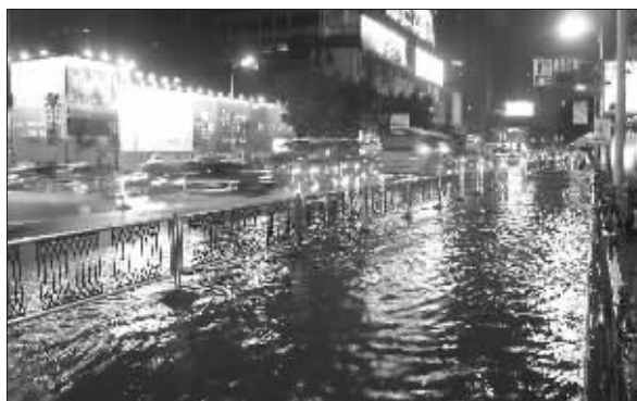
中山南路新街口段满是积水

昨天晚上8点左右,一场短暂的暴雨伴随着电闪雷鸣,突袭南京。中山南路新街口段、江东中路、集庆门大街东段、江东中路、汉中路地铁工地等多处积水深达20余厘米,给市民出行造成极大不便。