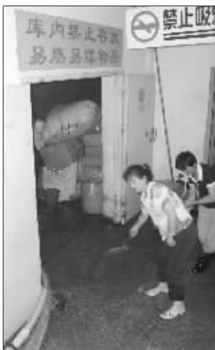
仓库内有許多货物泡在水中等待转移