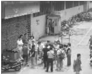
许多业主在西楼门口商讨赔偿问题