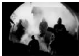
日军攻占南京的照片

以南京大屠杀为题材的纪录片,并邀请奥斯卡得奖纪录片《双子塔》的导演比尔·古登泰格和丹·斯图尔曼执导。纪录片以营救超过20万南京市民的22名“安全区”委员会国际人士的事迹为线索,从多角度描述出了南京大屠杀人间地狱的惨状。