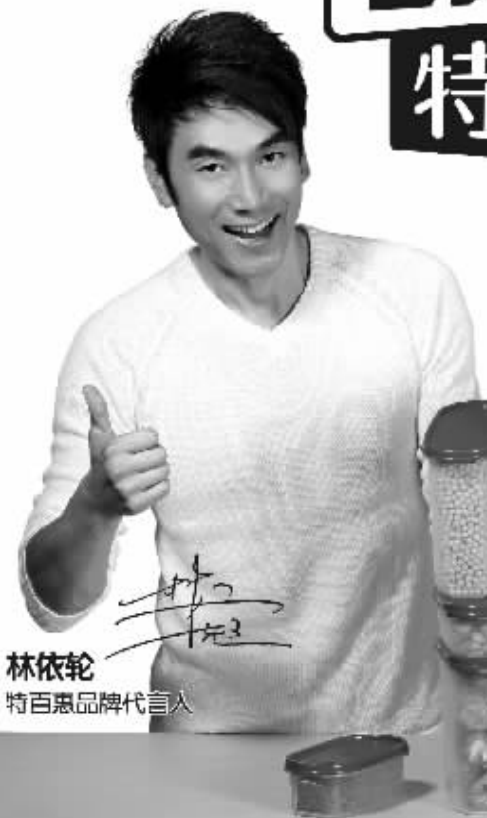
林依轮 特百惠品牌代言人