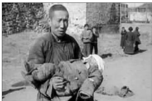
影片再现南京大屠杀的悲惨画面

尽管莱昂西斯一直称《南京》是一部反战电影,但他的个人网站和一名日本演员的个人网站仍受到一些日本网民和右翼分子的攻击。但莱昂西斯没有气馁,坚持把电影拍完,希望通过这部电影让人们正视南京大屠杀这个史实,并希望这部纪录片能在日本放映,让更多日本人了解这段历史。