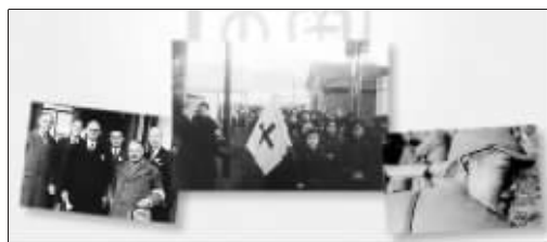
这些照片记录了那段历史

的许多著名档案馆,也确实发掘了不少重要的历史资料,如一部1937年日本拍摄的庆祝占领南京的战争宣传片。大屠杀发生时一名叫约翰·麦基的西方人用16毫米小摄影机冒险拍摄的40分钟录影带,这部粗糙的短片是《南京》中最让人脊背发凉的片断之一。