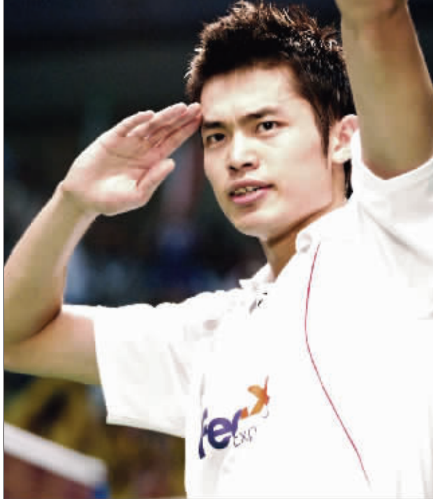
又见林丹行“军礼”,他的霸气也回来了

男单 林丹 2:0 黄宗翰(马来西亚) 女单 谢杏芳 2:1 张宁 混双 郑波/高崑 2:0 克洛格/拉克(英格兰) 男双 蔡赓/付海峰 2:0 马基斯/亨德拉(印尼) 女双 纳西尔/玛丽莎(印尼) 2:1 赵婷婷/杨维