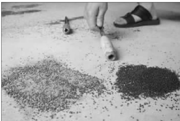
染色黄泥(左)足以乱真

快报讯(记者 孙玉春)一造假者用黄泥巴经过特殊加工成细小粒状后,染色冒充油菜籽卖给油料加工厂。近日,六合区横梁镇精炼食用油厂就截获了近50吨掺杂着黄泥巴的假油菜籽。