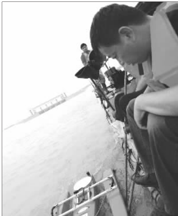
7月14日,淮入海水道二河新闸的工作人员正在测量洪水流量。