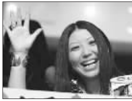
无论何时,杨二总是笑容满面