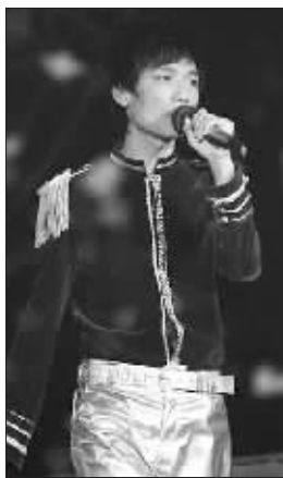
陈楚生有王者气质