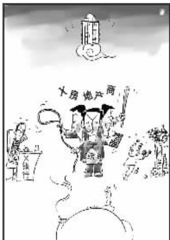
三头六臂 冯印澄 绘