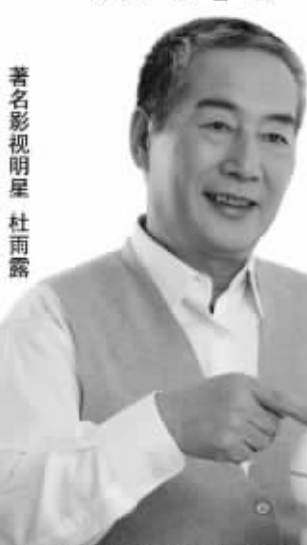
著名影视明星 杜雨露

15分钟，能作什么？对紫环牌颈椎治疗仪来说，15分钟时间，能舒舒服服治疗颈椎病：躺到上面，按下启动键，然后设定好时间，选好治疗模式，调整好强度就行。用紫环治疗仪，脖子感觉轻松，酸麻胀痛等症冰消瓦解，活动更灵活。紫环治颈椎，为什么这么好？原因是，紫环牌颈椎治疗仪，科学地将“枕式牵引、低中频电脉冲电疗、红外热灸、磁疗”集合在一台仪器里，可以4种方法同步治疗。