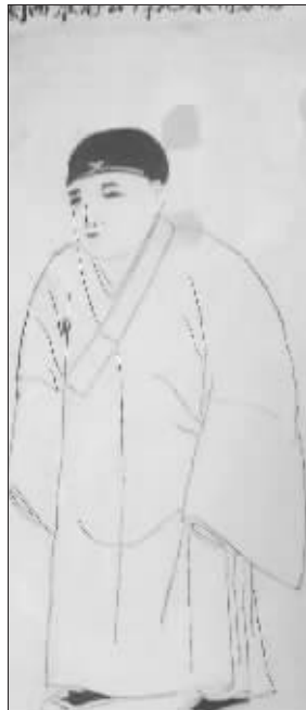
朱元璋小和尚画像

后来,在至正八年(1348年),朱元璋又回到皇觉寺,开始“立志勤学”,读书交友,开始了人生道路转折。在至正十一年(1351年),爆发了震撼全国的红巾军起义。这时朱元璋收到小时的穷伙伴汤和从濠州城(凤阳)悄悄捎来的一封信,信中讲的天下大乱,乡间也不能自保,自称已投奔郭子兴手下,并积功当了千户,望朱元璋“速从征,共成大业”。当时朱元璋对此有些犹豫不决。几天后,皇觉寺的师兄告诉他,有人告发他收到汤和来信一事,赶快逃走。恰逢元军这时把皇觉寺放火烧了个干净。朱元璋无处安身,遂去凤阳投奔郭子兴。从此,朱元璋投身在红巾军中,开始了他的戎马生涯。