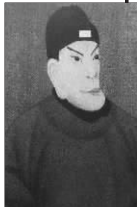
长脸大耳的朱元璋