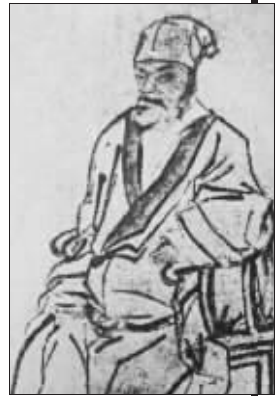
教科书中的朱元璋