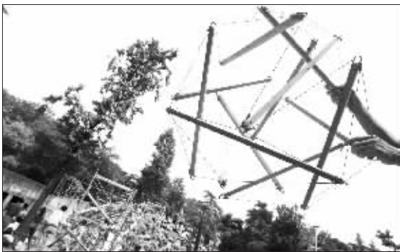
猴子的玩具“原子球”

红山动物园猴山里这两天可真是热闹,几十名来自南京大学建筑学院的学生正在为它们量身打造两个新玩具,造型还真够独特够前卫——一个像原子模型,另一个,则像DNA螺旋模型。