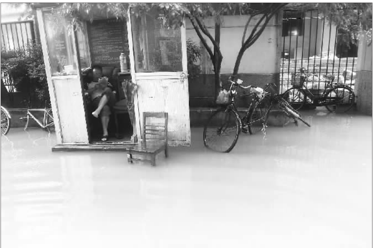
昨天,云南路金银街上积水严重,一位老者被困“孤岛”。