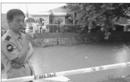
十里沟沟边上警方拉起了警戒线 快报记者 薛林 摄