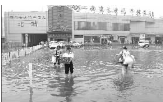
客运北站被淹

“到处都是水!赶车的人进不去,下车的人出不来。”昨天中午12点左右,天空仍不停地下着大雨,记者来到位于长江大桥桥北的南京长途汽车站客运北站,只见车站前的广场一片汪洋,两侧进、出站口各聚集着四五十名乘客,面对积水,他们不得不望“洋”兴叹。据了解,有数百人滞留车站。 由于车站出站口处就是公交站,许多乘客站在水中,焦急地等待公交车的到来。水位已经淹没公交车的底盘,20分钟内,就有三