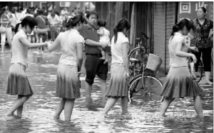
瞧这“四只美丽天鹅”只能在积水中缓步前行。