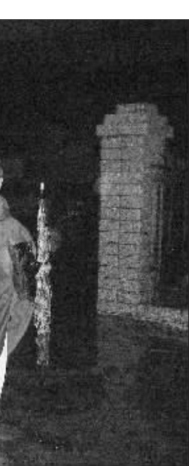
10个小时,中华门派出所民警救出51名老人 通讯员 秦公轩 快报记者 朱俊璇 摄

“要不是有一个防盗门挡着,肯定全被冲走了。” “没地方睡觉啊,我把搬得动的东西都搬到床上,而且水最高时,也赶上床高了。”家住南珍珠巷462号的施大妈称,席子湿了一半,还有一半是干的,“我就瘫在哪个角落几个小时。” “水太大,我家把被子都用来堵大门,但是基本没用,还是进了不少水。”居民丁女士指着门口几床湿透了的被子,十分无奈。“住在这边几十年都没被淹成这样过,有些人家还搞了几袋沙包来堵门,也没什么用。” 走访过程中,记者发现几乎每户居民家的桌上,床上都摆着冰箱、洗衣机等电器。 “我们社区2700户左