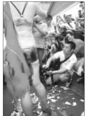
这个行为艺术作品叫《剪掉》