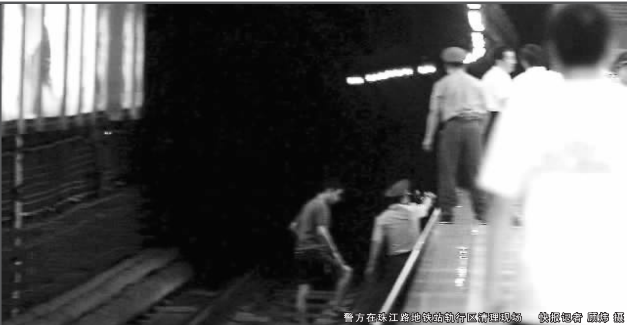
警方在珠江路地铁站轨行区清理现场

昨晚7:45,南京地铁珠江路站,一男子突然跳轨自杀,当场死亡,地铁运营受影响半个小时,8:15正式恢复。由于死者身上没有任何有效证件,所以还无法确认此人身份。据了解,这是南京第一起跳轨自杀事件。今年初,一名女乘客也企图跳轨自杀,但因为当时站台安全员发现她神色不对,上前询问并及时将其劝到办公室才避免了悲剧的发生。