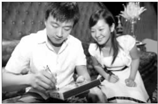
佟大为为学生签名

快报前天征集小眼睛美女参加佟大为影迷见面会的消息让很多粉丝乐开了花,南艺播音系和表演系的同学甚至集体报名要求参与。昨天,佟大为为了宣传今晚在江苏城市频道开播的《奋斗》如约到了南京。有意思的是,昨天这场在玛索酒吧举办的影迷会,倒更有些像佟大为向同学们传授经验的交流会。