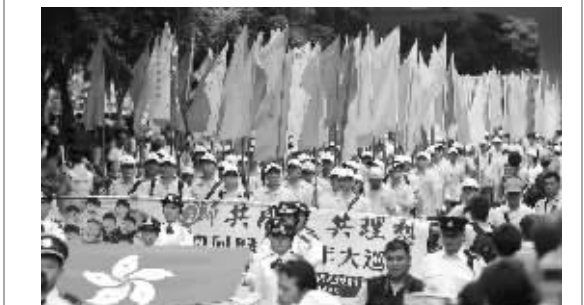
庆祝香港回归祖国十周年大巡游在香港举行。