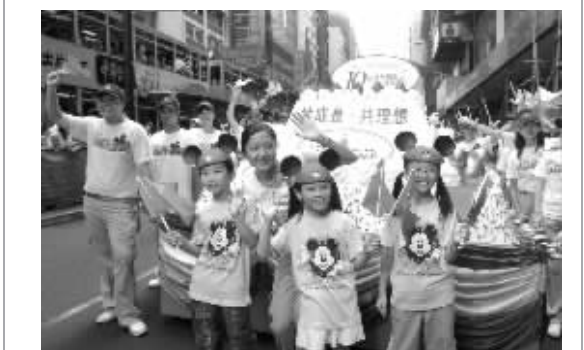
30名十龄童与香港共庆“生日”。