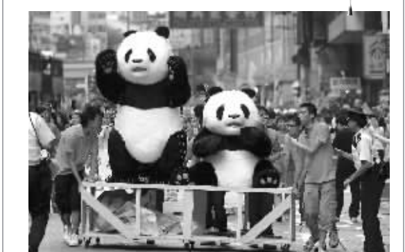
巡游队伍中的大熊猫模型。