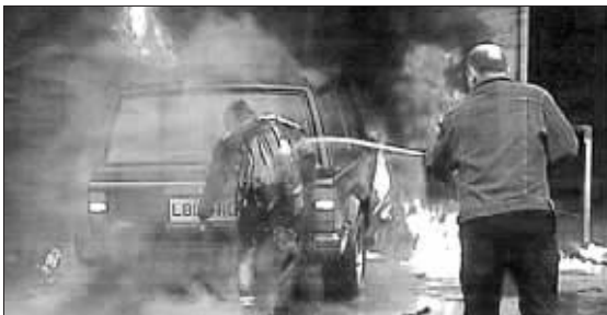
机场保安为人弹灭火