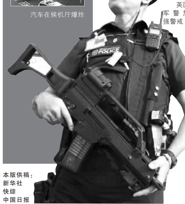
英国军警加强警戒

警方官员说,两枚炸弹“有明显联系”。专家说,这种汽车炸弹爆炸会形成巨大火球,导致严重的人员伤亡。