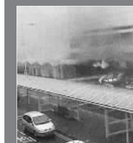
汽车在候机厅爆炸