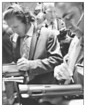
华尔街上埋头苦干的员工

去年年底,很多华尔街银行家获得了破纪录的巨额分红,因此而更加意气风发,但是与此同时,很多华尔街上的金融从业人员却在巨大的精神压力下开始出现情绪问题,甚至陷入崩溃。