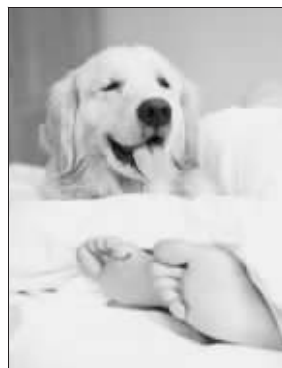
小狗可以闻嗅出癌症

一般认为,狗鼻子嗅觉强于人鼻子 1 万至 10 万倍。狗正是因为有着灵敏的嗅觉,能闻到肿瘤所释放出的细微而特殊的味道,才可以对癌症进行判断的。 综合消息