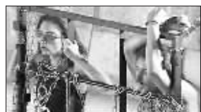
兄妹进行水下憋气挑战

据悉,盖丘纳斯兄妹俩以前也曾进行过其他惊人的极限挑战,譬如 2005 年,他们曾在 12 吨重的冰块中生活了大约 3 天。 欧阳