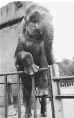
陆麦:好耶,我等你(设计台词)