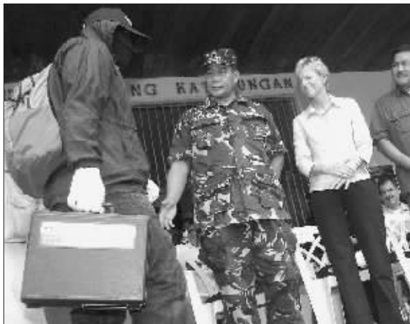
2007年6月7日,菲律宾南部霍洛省议会大楼内,一名头戴面具的“线人”手拎着装有赏金的提箱走人。

由于担心身份曝光引来杀身之祸,这些“线人”戴着面具接过沉甸甸的赏金。美国和菲律宾当局希望,巨额赏金的发放能够帮助他们获得更多的情报,彻底捣毁阿布沙耶夫反政府武装。