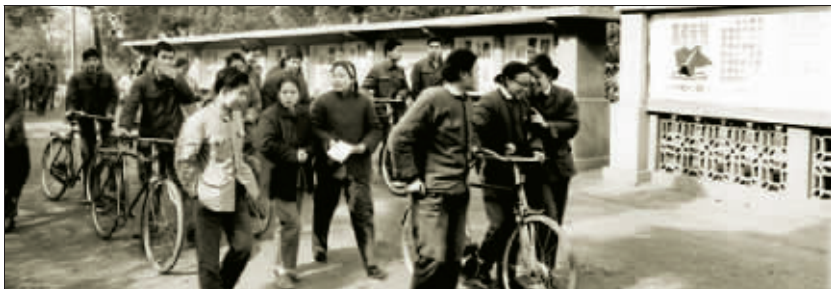
1977年,参加首次恢复高考的长沙考生从考场走出 (资料图片)