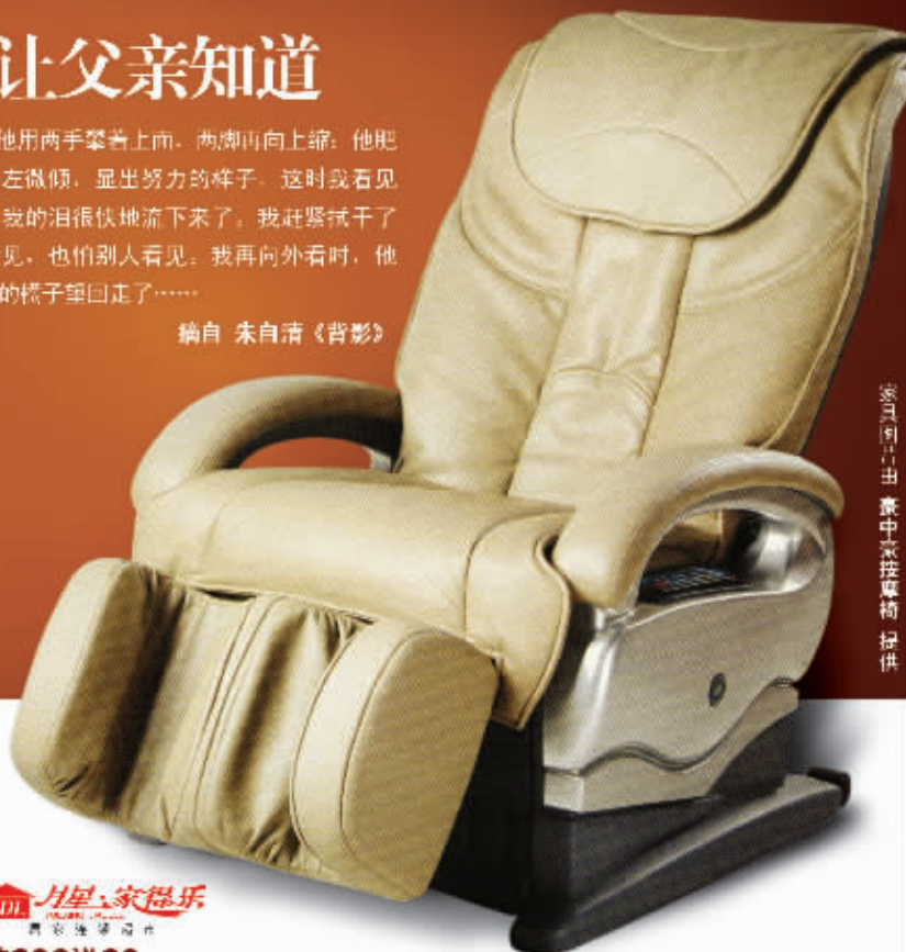
图例由中豪中文按摩椅提供