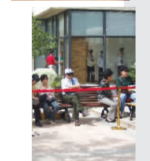
图片均为东郊小镇实景