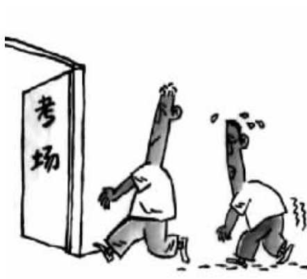
临考心态 资料图片