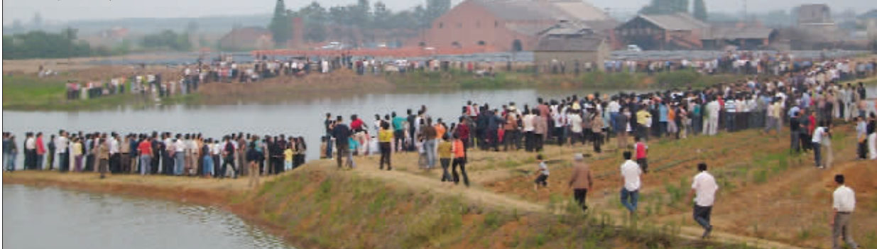
孩子落水,牵动了几百村民的心

“快来人啊!有小孩掉水里了,快不行了!救命啊……”昨天下午3点,从溧水县明觉镇农贸市场东面传出的呼救声,几乎将集镇所有居民的心揪住。从昨天下午3点到6点半,农贸市场东头的深水池塘边上,几百名居民聚集在一起,大家都在关注落水儿童的命运。最终,落入池塘的6名儿童,2人侥幸逃离、2人获救、2人溺亡。