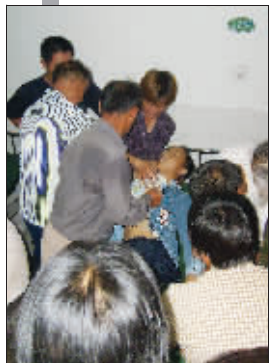
周围群众奋力救人