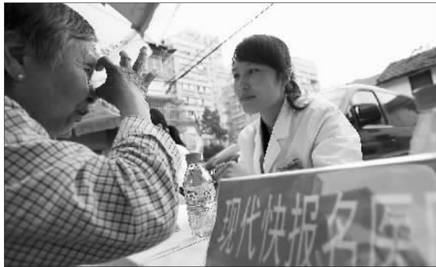
社区居民纷纷咨询眼疾问题

白内障分为先天性、老年性、并发性等几种类型,大家最关心的就是如何才能有效地预防。陈晖说,发育性白内障是可以预防的,母亲在怀孕期间要避免对胎儿造成损害。日常生活中,要防止机械性物质、放射线对眼睛的