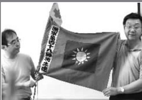
一面军旗 70 年后重回南京