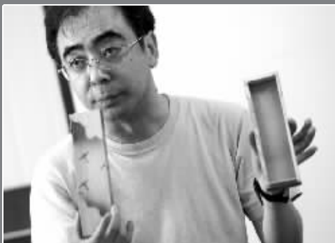
当年日本孩子用的铅笔盒都有浓厚的军国主义色彩