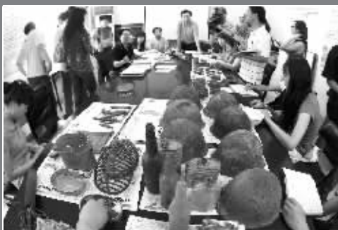
江东门纪念馆昨天还展示了一批从东北收集来的文物