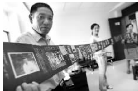
▲被日军打得千疮百孔的“南京城一角”