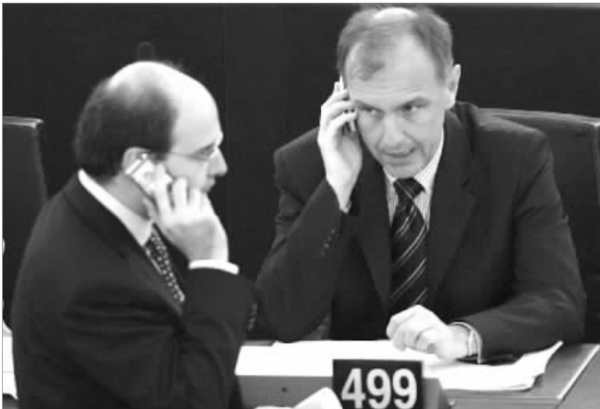
23日,欧洲议会议员在法国斯特拉斯堡召开欧洲议会会议。

国发言的约阿希姆·维尔梅林说,他希望欧盟27个成员国6月29日前接受限价措施,手机运营商7月底前各自设定资费上限,8月底前付诸实施。