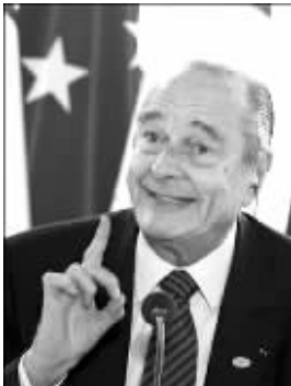
法国前总统希拉克

一家“文化基金会”于1992年以希拉克的名义,在东京相和银行开设账户,并在此后数年内陆续存入大约3000万英镑的资金。不过希拉克否认他在日本设有秘密账户。