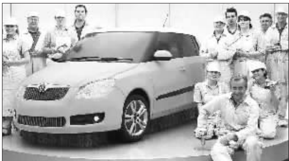
面包师们和他们成功造出来的“可食用小汽车”