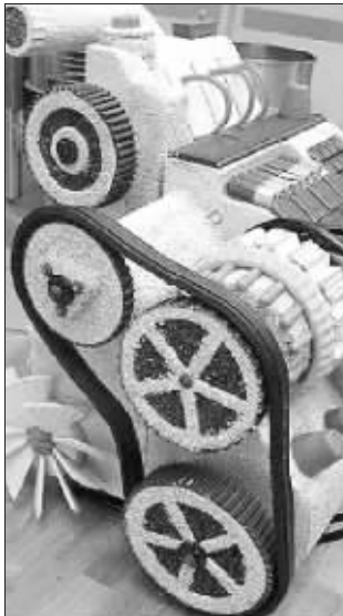
巧克力和蛋糕做成的发动机

你见过可以吃下肚子的小汽车吗?斯柯达汽车公司为了给一款新法比亚轿车做广告,请一组面包师和模型制造师用巧克力和蛋糕等食品造出了一辆和真汽车外表一模一样的小汽车模型。这辆“小汽车”从车身、车窗到车轮、发动机,全都可以食用。这辆“可食用”小汽车一共用了180个鸡蛋,100公斤面粉、100公斤调味糖和数不清的巧克力浆以及448块馒头状蛋糕。