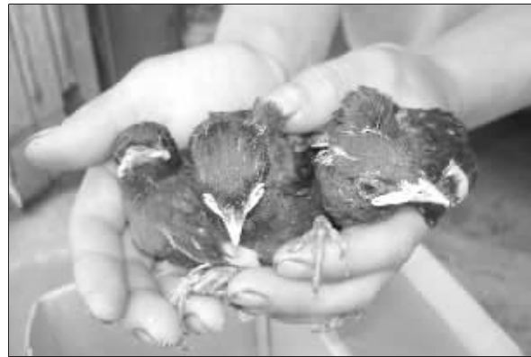
三只可爱的小八哥