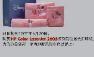
发布日期:2007年6月30日 惠普 HP Color LaserJet 2605 系列彩色激光打印机 为办公添彩, 中小企业最佳打印选择。