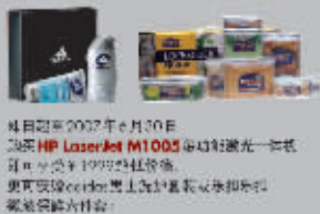
发布日期:2007年6月30日 惠普 HP LaserJet M1005 多功能激光一体机 零售价为1,999元起, 含纸。 更多了解ColorJet系列打印机, 请访问 www.hp.com.cn