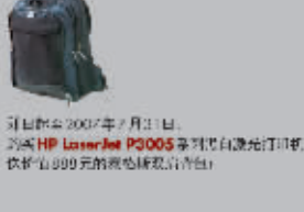
发布日期:2007年7月1日 惠普 HP LaserJet P3005 系列黑白激光打印机 仅售1,599元的超值选择。

致电 800-820-2255 或 400-820-2255 未开通地区请拨打: 021-50504800 工作时间: 周一至周五 08:30-18:00 登录 www.hp.com.cn