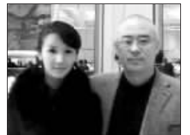
郑渊洁和孙菲菲的合影

童话大王郑渊洁曾在年初与孙菲菲一起参加湖南台的全明星英雄会,据媒体当时的报道,孙菲菲当天的造型很性感,“谋杀”了在场男性的眼球,也包括评委郑渊洁。当时,郑渊洁点评说:“我就是喜欢看漂亮的女孩,所以我支持孙菲菲。”近日有网友在论坛上发表