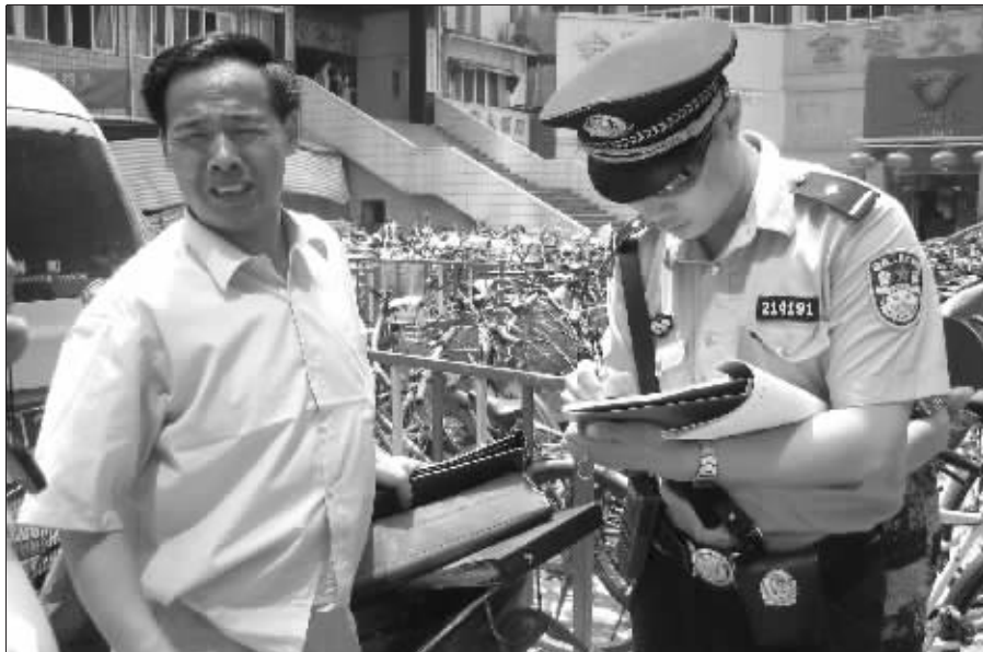
老黄说起刚才的遭遇,懊恼异常

昨天,发生在金鑫大厦的一幕把不少人都惊呆了。最后,只有8楼的一名男子从窗口凌空抓到一张纸币,交给了皮包的主人,而其余77张百元大钞均没了踪影。