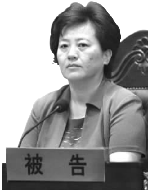
出庭应诉的海安县长单晓鸣