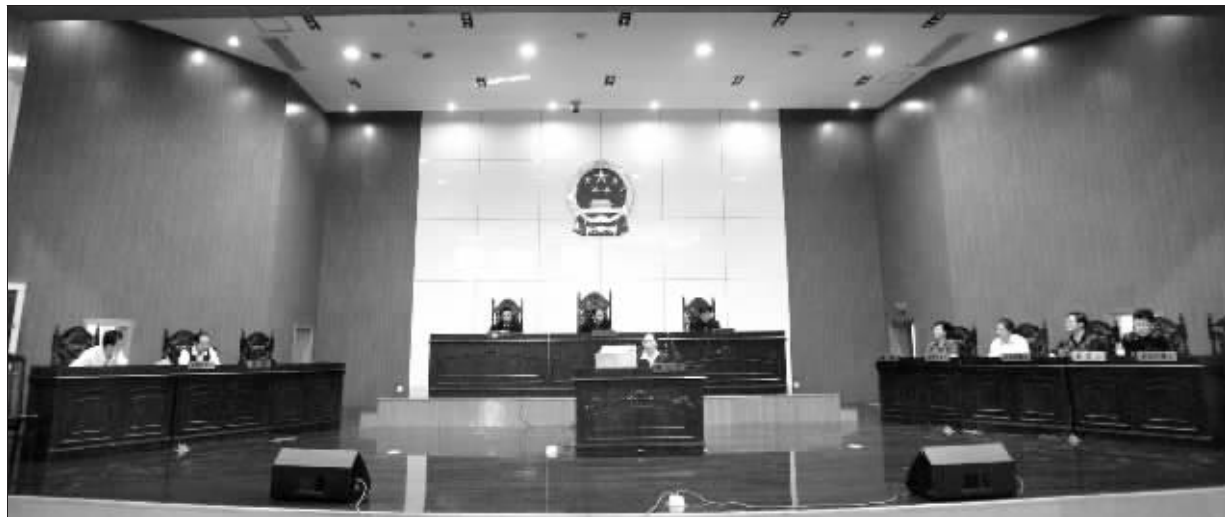
行政首长出庭,意味着对法律精神的尊重

1964年出生,江苏如东人,南京大学MBA硕士 1997年7月,担任如皋市副市长 1997年11月,如东县委常委、宣传部部长 2001年1月,如东县委常委、常务副县长 2002年5月,如东县委副书记、常务副县长 2006年12月,海安县委副书记、代理县长 2007年1月,海安县委副书记、县长