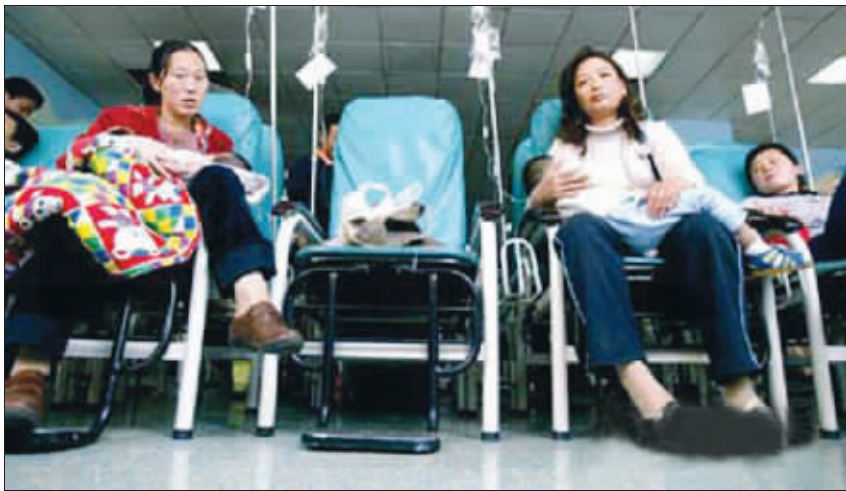
医院接收的病孩比平时多出许多,院方称年年这个时候都会出现这种现象。

5月13日,记者向临沂市卫生局、临沂市政府新闻科、临沂市疾控中心询问临沂市儿童感染手足口病的具体疫情时,对方仍然拒绝提供具体发病数字,并称不公布发病数字,是怕引起群众恐慌。但是,记者在与患者和市民的接触中发现,因为不了解疫情,不仅这一并不奇怪的病症的治疗遭到延误,而且谣言也随之四起。