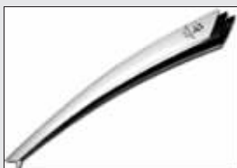
第二十七届奥运会火炬(2000)