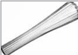
第十九届奥运会火炬(1968)