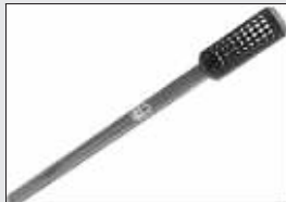
第二十一届奥运会火炬(1976)