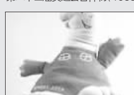
第二十八届奥运会吉祥物(2004)