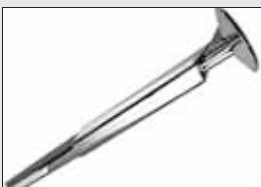
第二十五届奥运会火炬(1992)