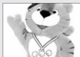
第二十四届奥运会吉祥物(1988)