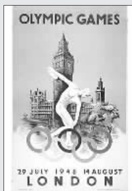
第十四届奥运会海报(1948)