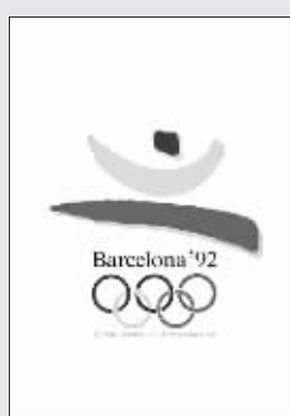
第二十五届奥运会海报(1992)