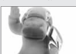
第二十七届奥运会吉祥物(2000)