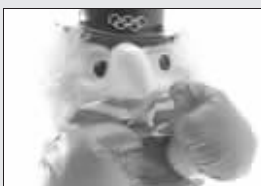
第二十三届奥运会吉祥物(1984)