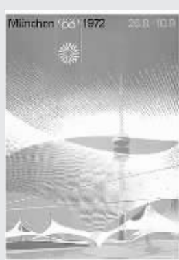
第二十届奥运会海报(1972)