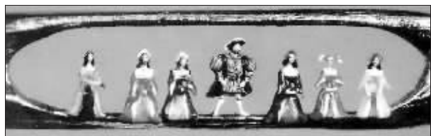
图为针孔中的亨利八世和他的6个妻子雕像