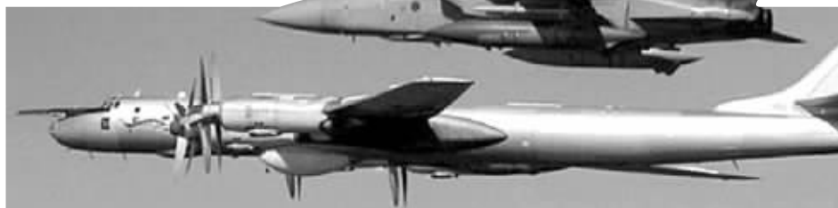
上方为英军的“狂风”战斗机,下方为俄军的“熊”式轰炸机

英国皇家空军两架“狂风”F3战斗机从位于范夫的卢哈斯空军基地紧急起飞,在国际领空进行拦截。当时,英、俄双方飞机的距离很近,但驾驶员没有进行无线电联系。在英国战斗机“护送”飞行15分钟后,俄军的“熊”式轰炸机才调转方向,向摩尔曼斯克的基地飞回去。英国皇家空军瓦尔德劳