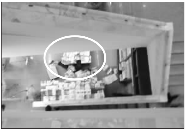
女子是从楼梯间的空隙坠落身亡的(画圈处为死者)

“就听‘咚’的一声闷响,一个女的突然掉在书店一楼楼梯旁的拐角处,血溅了一地。”昨天下午6点左右,一名女青年从新街口新华书店4楼与5楼之间的楼梯拐弯处坠落,砸伤在一楼楼梯口看书的一名30岁女子,坠楼女子当场死亡。