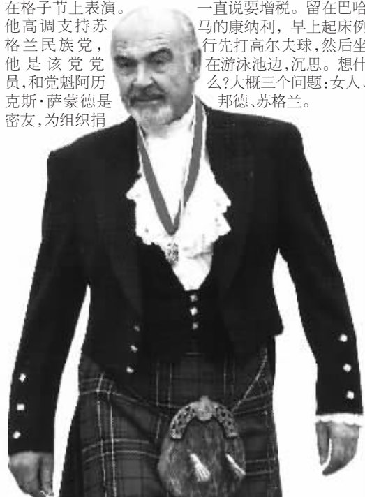
“007”肖恩·康纳利身穿苏格兰格子裙

即使苏格兰独立了,康纳利大概也不会回国,因为执政的苏格兰民族党一直说要增税。留在巴哈马的康纳利,早上起床例行先打高尔夫球,然后坐在游泳池边,沉思。想什么?大概三个问题:女人、邦德、苏格兰。