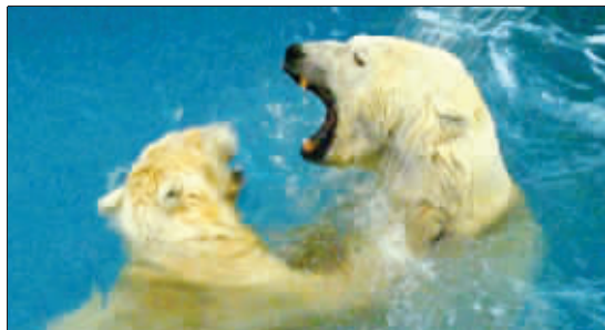
隔笼相望了一个多月,昨天,海底世界两只北极熊终于共处一室。可能是寂寞太久了,“第一次亲密接触”的方式有点奇特:两只熊大战了一个小时才罢休。

■曾为张艺谋的 电影写片名 书法家许静 做客生活南京 时间:19:00-20:00 嘉宾:许静 青年书 法家