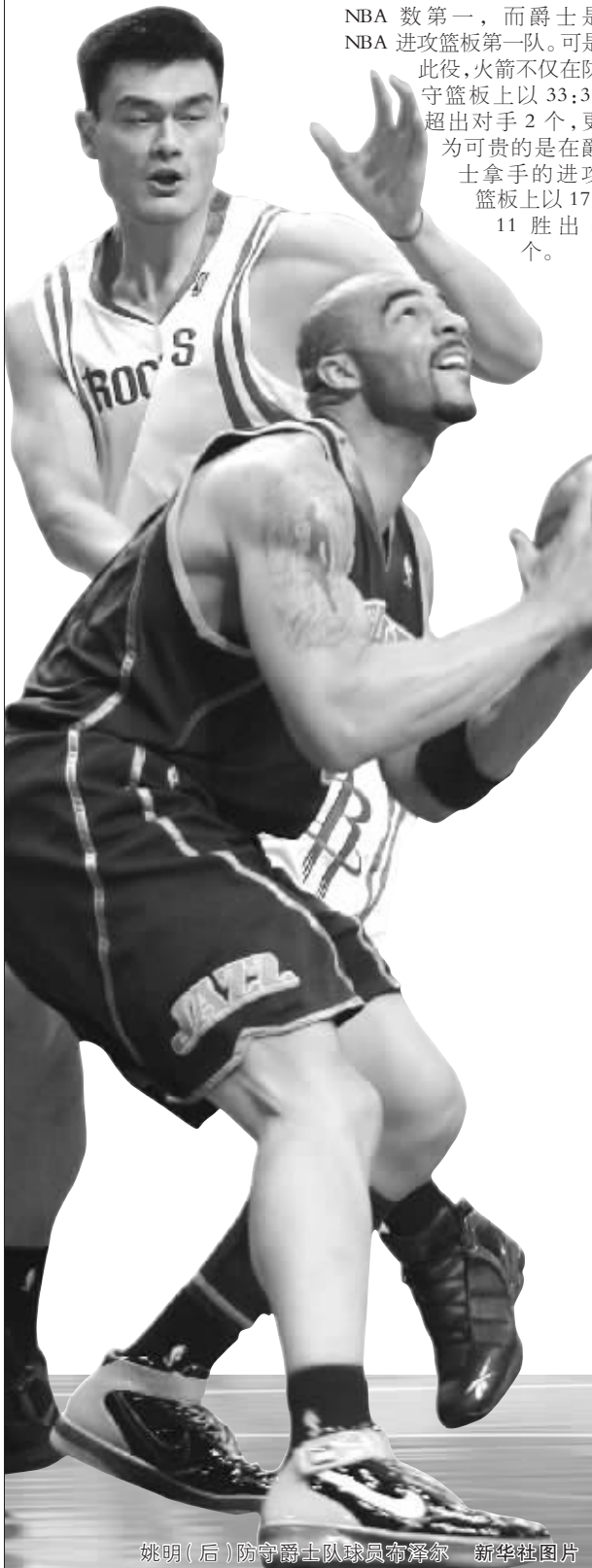
姚明(后)防守爵士队球员布泽尔