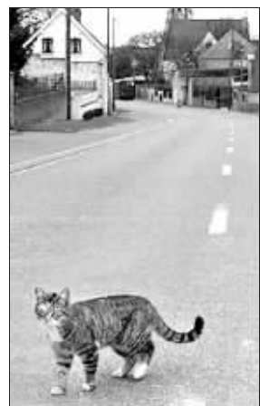
“米米妮”难以置信的跋涉之旅

令人难以置信的是,在经过 13 个月时间、跋涉了 800 公里的距离后,宠物猫“米米妮”日前终于奇迹般地来到了特里维内市,并且找到了旧主人一家。“米米妮”的旧主人本来以为这只猫正安全地生活在新家庭中,所以当他们在看到“米米妮”突然出现在他们新家的门口时,他们全都惊呆了,不敢相信自己的眼睛。