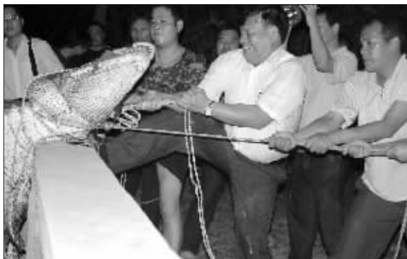
21日,工作人员将杀死的鳄鱼拖起。