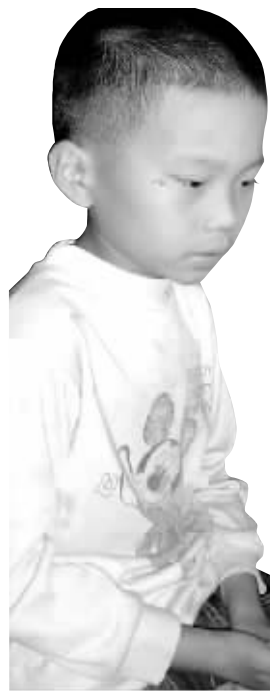
这名目睹惨剧的男孩被吓坏了

4月20日下午6时许,一名9岁男孩跟伙伴到广西北海银滩附近的一个鳄鱼池边玩耍时,被饥饿的鳄鱼扯下池内撕碎吞噬。