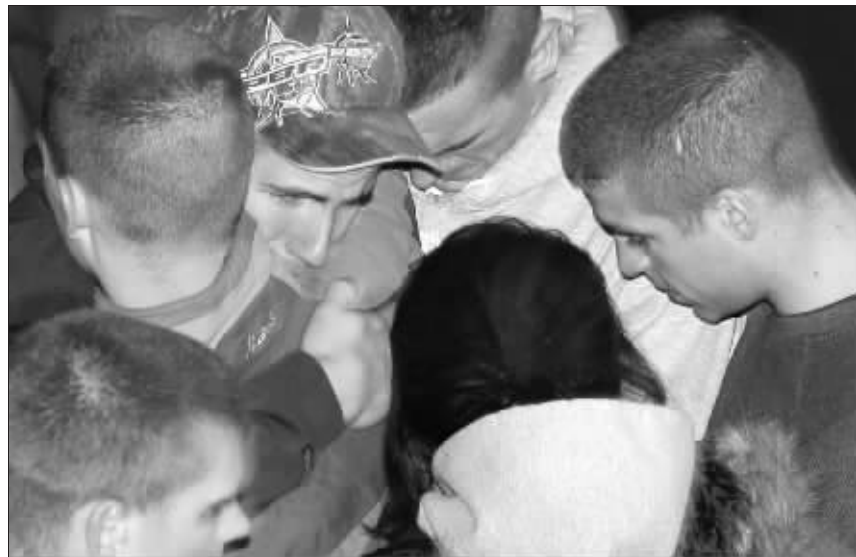
4月16日夜,美国弗吉尼亚理工学院学生在校内守夜,悼念遇难同学

据新华社电 韩国外交通商部长官宋■淳在得知美国弗吉尼亚理工大学枪击案主犯可能是韩国人后,17日晚紧急召开特别对策会议,商讨有关对策。